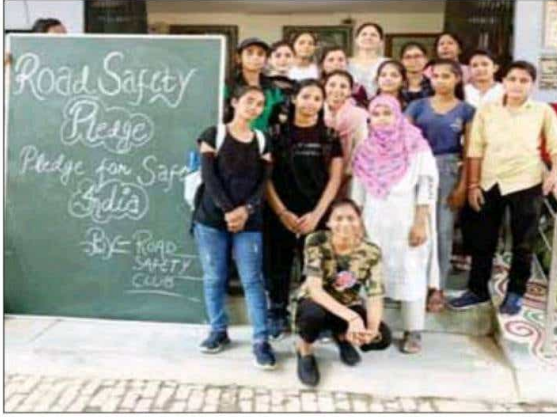
कार्यक्रम में मौजूद छात्रायें।

कानपुर, 24 जुलाई। महिला महाविद्यालय किदवई नगर में राष्ट्रीय सेवा योजना इकाई के स्वयंसेविकाओं द्वारा रोड सेफ्टी क्लब का गठन किया गया व समाह भर सड़क सुरक्षा पर होने वाले कार्यक्रमों की रूप रेखा