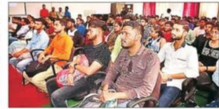
राजकीय इंजीनियरिंग कॉलेज में आयोजित कार्यक्रम में मौजूद छात्र। अनुरा