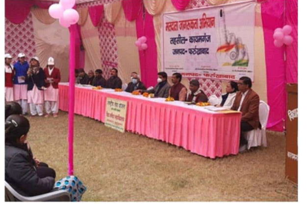
राष्ट्रीय सेवा योजना, संत कबीर इकाई विद्या मन्दिर महाविद्यालय कायमगंज द्वारा मतदाता जागरूकता कार्यक्रम 2023 का आयोजन