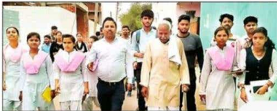
बकेवर क्षेत्र के गांव में भ्रमण करते स्वयंसेवक। संख्या 8

बकेवर। जनता कॉलेज बकेवर की राष्ट्रीय सेवा योजना इकाई के सात दिवसीय विशेष शिविर में स्वयंसेवकों को चार सत्रों में योग, खेती, जल संरक्षण व पर्यावरण की जानकारी दी गई।