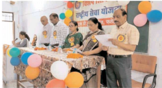
कार्यक्रम के शुभारंभ पर मौजूद अतिथिगण