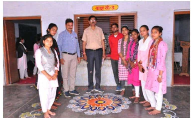
राष्ट्रीय सेवा योजना, संत कबीर इकाई विद्या मन्दिर महाविद्यालय कायमगंज द्वारा सात दिवसीय विशेष शिविर 2023 में रंगोली प्रतियोगिता का निरीक्षण करते महाविद्यालय के प्राचार्य व कार्यक्रम अधिकारी