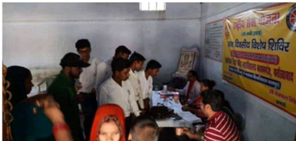
महाविद्यालय इकाई द्वारा 2023 में हेल्थ मिशन के अन्तर्गत हेल्थ दिवस का आयोजन