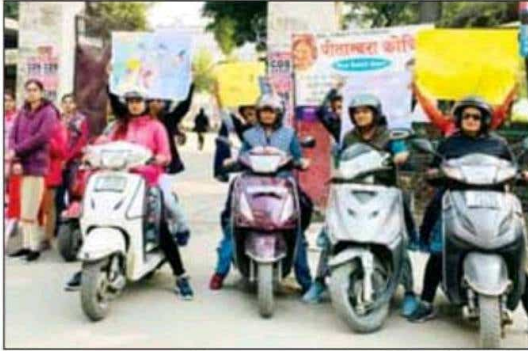
स्कूटी रैली निकालती महिला महाविद्यालय की छात्रायें।