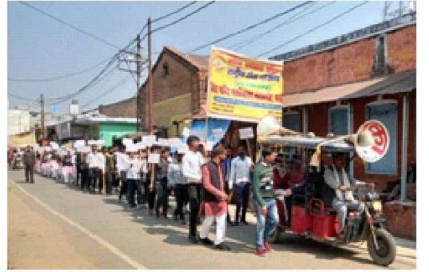
राष्ट्रीय सेवा योजना, संत कबीर इकाई विद्या मन्दिर महाविद्यालय कायमगंज द्वारा मतदाता जागरूकता कार्यक्रम 2023 के अन्तर्गत मतदाता जागरूकता रैली का आयोजन।