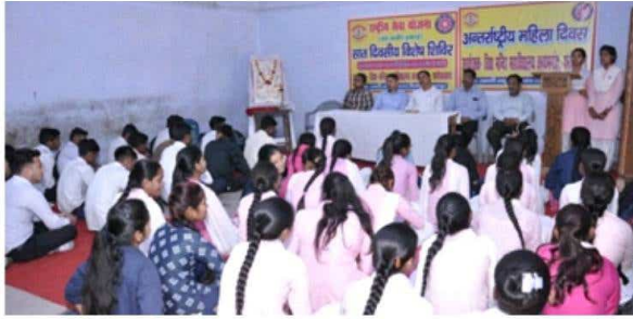
राष्ट्रीय सेवा योजना, संत कबीर इकाई विद्या मन्दिर महाविद्यालय कायमगंज द्वारा अन्तर्राष्ट्रीय महिला दिवस कार्यक्रम का दृश्य।