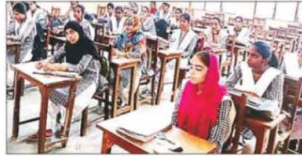
राजकीय महिला महाविद्यालय में छात्राओं को मिली जानकारी। अनुरा

साइबर जागरूकता दिवस पर कॉलेजों में दी गई जानकारी